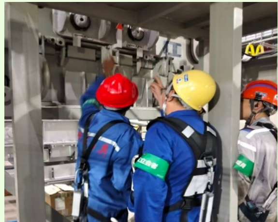
操作及び日常保全トレーニング