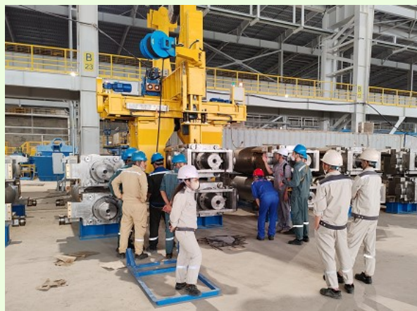
操作及び日常保全トレーニング